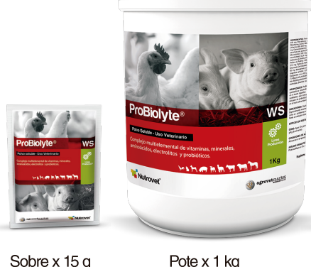
Sobre x 15 a

En general, 200 - 250 g/tonelada de alimento (0.20 - 0.25 g / kg de alimento).