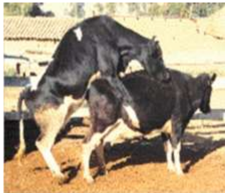
Figura 1: Una vaca está en celo cuando permanece inmóvil cuando es montada por otra vaca o toro (la vaca de la derecha de esta foto).