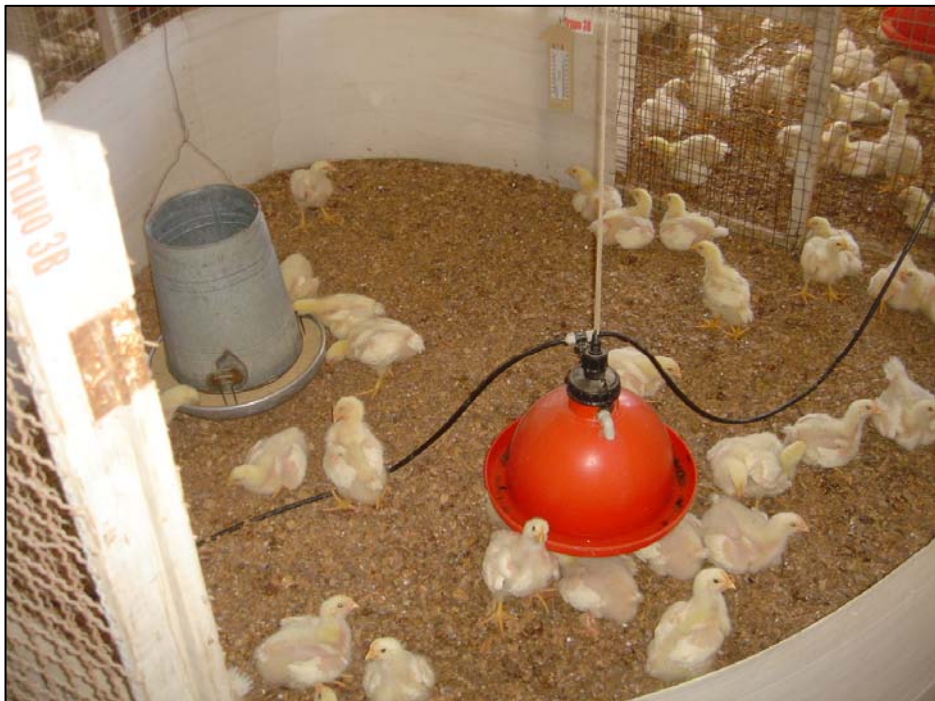
Vista de aves del Grupo B (Repetición 3)