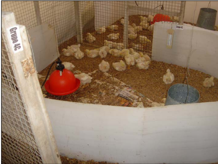
Vista de aves del grupo C (Repetición 4)