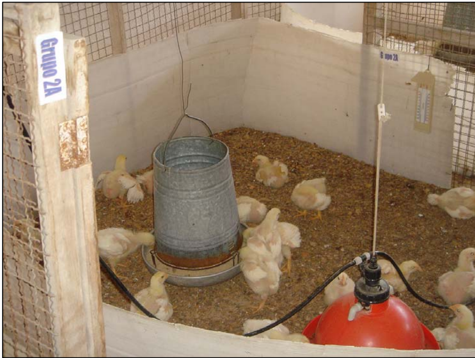
Vista de aves del grupo A (Repetición 2)