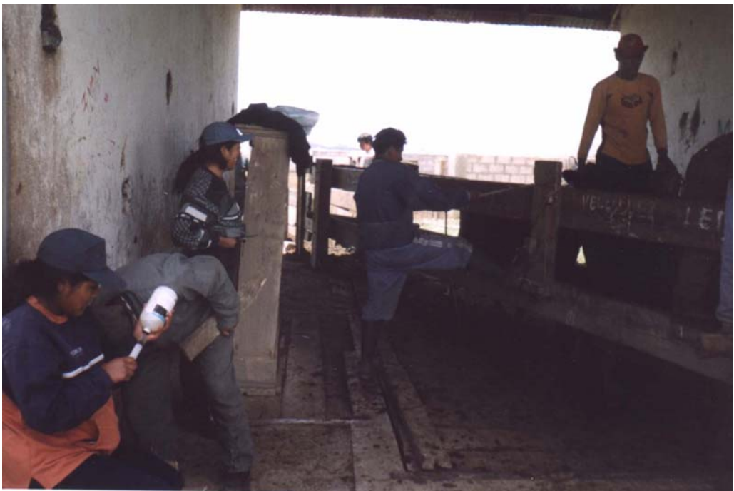
FOTO 2.- IDENTIFICACIÓN CON ARETES Y CONTROL DE PESO DE LAS VACAS: AL INICIO DEL ESTUDIO.