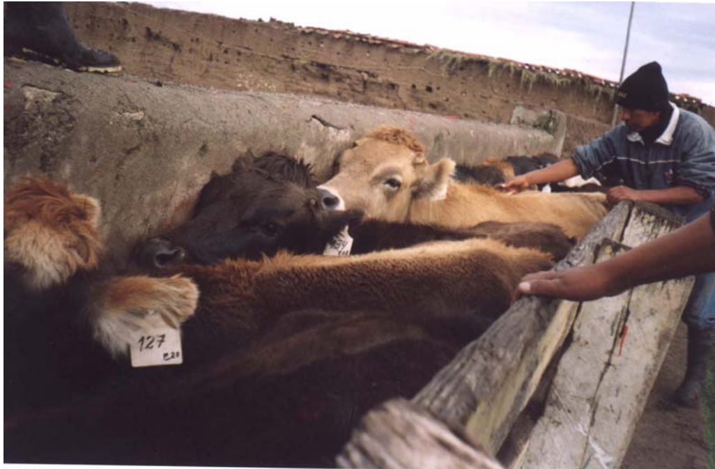
FOTO 3.- RECOLECCION DE MUESTRAS FECALES EN EL GRUPO DE VACAS EN ESTUDIO.