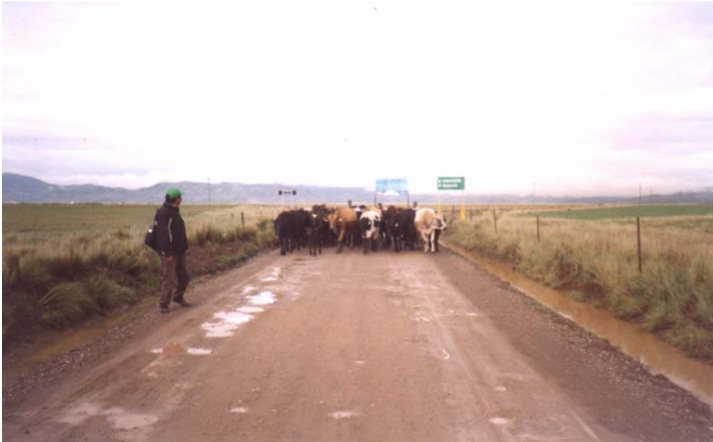
FOTO 1.- GRUPO DE ANIMALES EN ESTUDIO