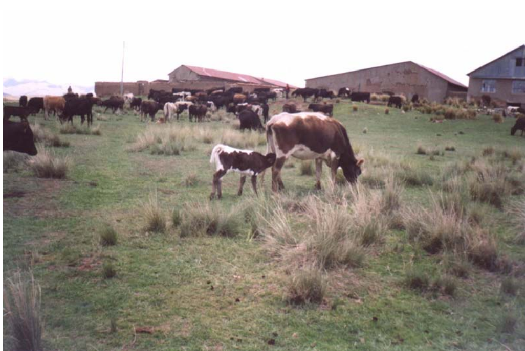
FOTO 4.- VACAS CRIOLLAS DEL I.I.B.O. DE LA FACULTAD MVZ.