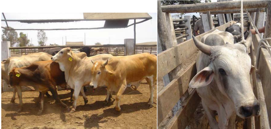
Foto 1 y 2. Animales de ensayo numerados