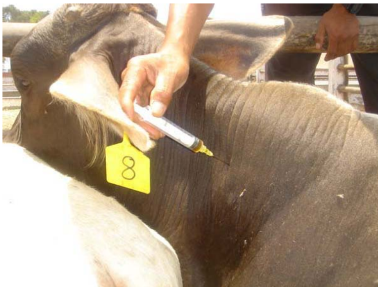
Foto 5: Aplicación vía Intermuscular profunda de Duramycin 300 LA